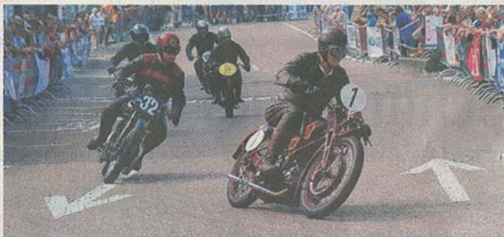
Die Motorradfahrer holten alles aus ihren Maschinen.