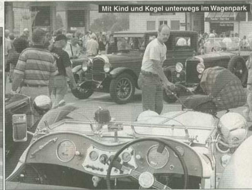
Mit Kind und Kegel unterwegs im Wagenpark