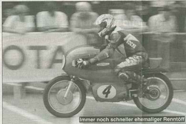
Immer noch schneller ehemaliger Renntöff