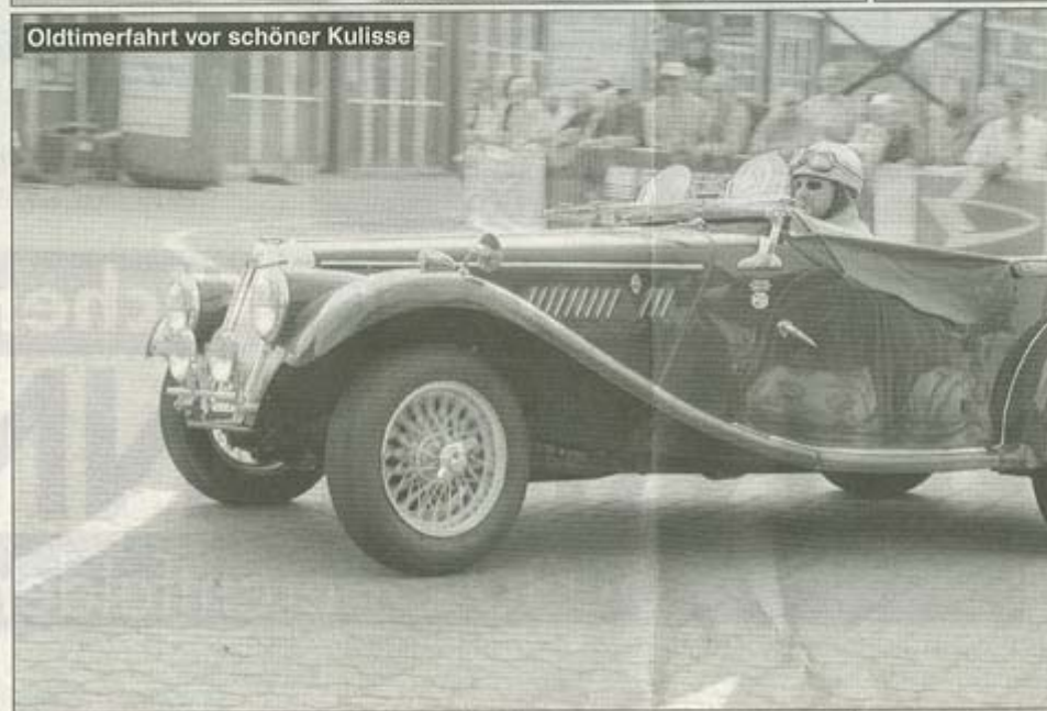
Oldtimerfahrt vor schöner Kulisse