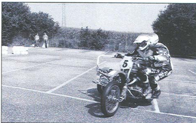
Rasanter Motorsport: Nicht nur eine Augenweide, auch die Ohren bekommen einiges davon ab.

etwas Applaus begleitet, vor allem aber auch von Menschen, die neidlos die alte Fahrzeugtechnologie bestaunen und sich darüber freuen, dass es noch immer Fanatiker gibt, die diese Bijoux mit viel Herzblut pflegen.