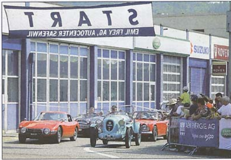
Alle warten gespannt auf den Start.