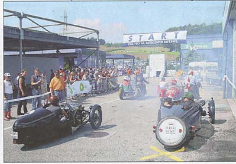
Dröhn, brumm – gleich gehts los!