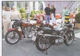
Zwei echte «Knattertons».