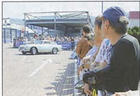
Ein Hauch James Bond mit dem Aston Martin DB5.