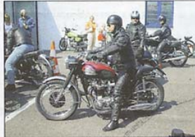
«Heh, wär fötelet do so wild im Zügs ome?»