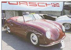
Treibt jedem Forschefan das Freudenwasser in die Augen – der legendäre 356.