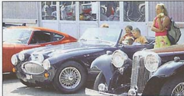
«Papi, wann gehts endlich los?», fragen diese jungen Oldtimer-Fans.