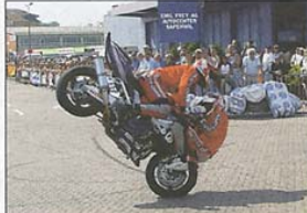
Radical Wheels aus Brasilien und die hohe Kunst der Stoppies.