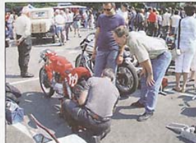
Schrauben macht Spass.

Nicht zuletzt das tolle Herbstwetter lockte wieder viele Besucher nach Safenwil. (kl. Bild): Ein Kollege ist auch fleissig am «Fötele». Und wiederum darf man auch die 13. Ausgabe des Oldtimer-Grandprix als vollen Erfolg bezeichnen.