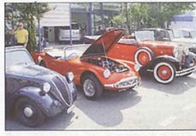
Die auf Hochglanz polierten Prachtstücke glänzten um die Wette.