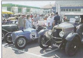
Das waren damals noch Autos!